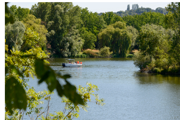
2019-08 Autour du lac de Venables 1

La Seine prend sa source à Source-Seine, en Côte-d'Or, sur le plateau de Langres et se jette dans la Manche entre Le Havre et Honfleur. Son principal affluent dans le département est l'Eure qui se jette dans la Seine à Pont de l'Arche en aval de Venables-Les Trois Lacs. C'est le quatrième plus important derrière l'Oise, la Marne et l'Yonne.