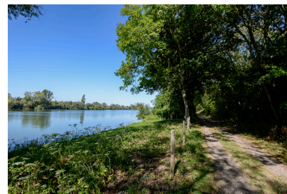
2019-08 Autour du lac de Venables 9