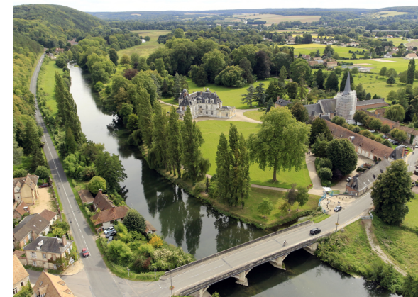
Seine Eure Tourisme