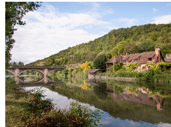
Seine Eure Tourisme