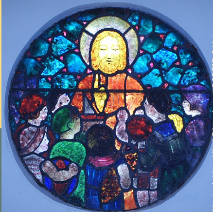
Musée du Verre Vitrail Décorchemont

Les célèbres verrières du cœur de l'église S te -Foy constituent un exemple unique en France de l'art verrier du XVI e siècle et témoignent de la richesse de cet art dans l'Eure, qui compte plus de 6 000 m 2 de verrières antérieures à la Révolution. Conches est aussi la patrie du maître-verrier François Décorchemont (1880-1971), artiste novateur reconnu pour sa technique unique appliquée à l'art du vitrail. Un Musée du Verre et de la Pierre lui est en partie consacré.