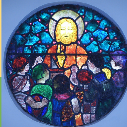
Musée du Verre Vitrail Décorchemont

Les célèbres verrières du cœur de l'église S te -Foy constituent un exemple unique en France de l'art verrier du XVI e siècle et témoignent de la richesse de cet art dans l'Eure, qui compte plus de 6 000 m 2 de verrières antérieures à la Révolution. Conches est aussi la patrie du maître-verrier François Décorchemont (1880-1971), artiste novateur reconnu pour sa technique unique appliquée à l'art du vitrail. Un Musée du Verre et de la Pierre lui est en partie consacré.